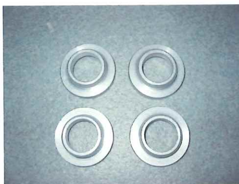
S15系メンバー下側、BNR34系