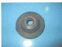
この部品は使用しません。

・クロスメンバー無の車両は、図のように取り付けてください。 その場合ノーマルで取り外した部品は使用しません。